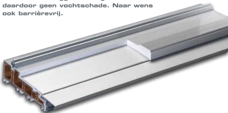
Energiebesparend en barrièrevrij: ThermoTop® - de warmte-isolerende onderdorpel voorkomt koudebruggen. Dus geen condenswater en daardoor geen vochtschade. Naar wens ook barrièrevrij.

U zult het merken wanneer het HAUTAU is.