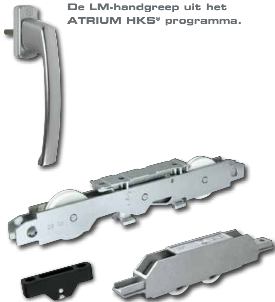
De LM-handgreep uit het ATRIUM HKS® programma.

Een kleine draai aan de handgreep en de aandrijving is ontgrendeld; dankzij de uitstekende looprollen is de vleugel supereenvoudig te verschuiven. ATRIUM S 300 beschikt over reinigingsborstels en een blokkering tegen een verkeerde bediening.