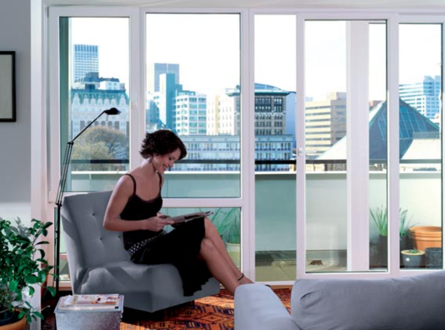
Mănerul LM 161 din catalogul ATRIUM HKS®