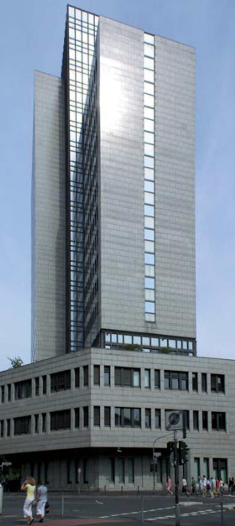
HAUTAU PRIMAT kompakt : banca centrală de land din Düsseldorf, Germania